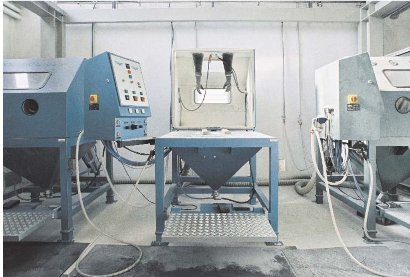
Bloß Gummiwände habe ich keine gesehen, in der Gummifabrik.